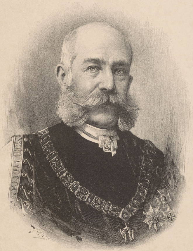
FRANTIŠEK JOSEF I.