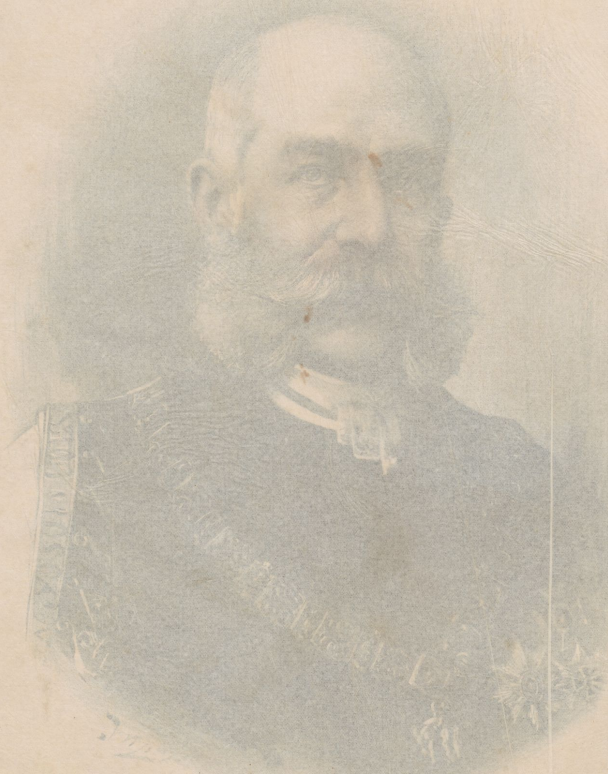
FRANTIŠEK JOSEF I.